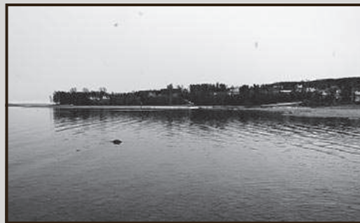
SMØRVIKA: Et gjengrodd område av Smørsvika, i skråningen mellom Kapp bo- og servicesenter og Mjøsa, planlegges utviklet til boligformål i kommunal regi.