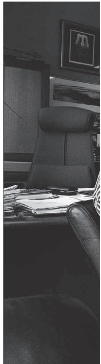
STORKONTRAKTER: Nammo og for å utvikle rakettmotorer.

– Denne bransjen er sånn. Disse kontraktene vil først og fremst gi oss trygghet i årene som kommer og vil gi seg utslag først om 10 til 15 år. Men det er klart at dette er med på å trygge de arbeidsplassene